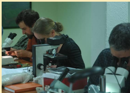
Identification minutieuse en laboratoire