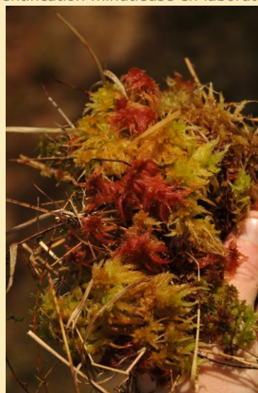
Sphagnum subnitens (en rouge), telle que visible dans la nature