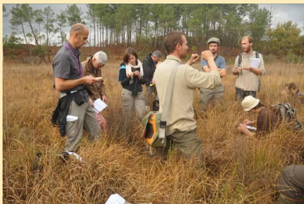
Repérage des sphaignes sur le terrain